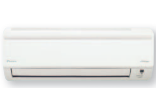
Внутренний блок FTX20,25,35JV

Примечания: 1) Класс энергоэффективности: шкала от А (более эффективное) до G (менее эффективное) - 2) Годовое потребление энергии: данные рассчитаны исходя из 500 часов работы в год при полной нагрузке (= номинальный режим). - 3) V1 = 1 ф. 230 В,50 Гц - 4) Номинальная холодопроизводительность: температура внутри помещения 27°CDB/19°CWB • температура наружного воздуха 35°CDB/24°CWB • длина труб с хладагентом 5 м - 5) Номинальная теплопроизводительность: температура внутри помещения 20°CDB • температура наружного воздуха 7°CDB/6°CWB • длина труб с хладагентом 5 м • перепада уровня 0м. - 6) Приведенные производительности представляют собой «нетто»-величины, в которых учтено снижение холодопроизводительности (или соответственно увеличение теплопроизводительности), связанное с нагревом двигателя вентилятора внутреннего блока - 7) Блоки необходимо выбирать по номинальной производительности. Максимальная производительность ограничена периодами пиковой нагрузки. 8) Уровень звукового давления измерен с помощью микрофона, расположенного на определенном расстоянии от блока (условия измерения: указаны в сборниках технических данных) - 9) Уровень звуковой мощности является абсолютной величиной, указывающей «мощность», производимую источником звука.