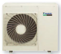
Наружный блок RX71GV